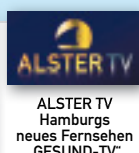
ALSTER TV Hamburgs neues Fernsehen „GESUND-TV“ „IMMO TV“